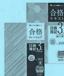
テキスト・トレーニング