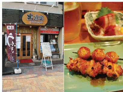
仕事の疲れも吹っ飛ばす「お疲れ様セット」。クセになるうまさだ。

1階はカウンターとテーブル席、2階は襖で仕切られたお座敷が3部屋。仕切りの襖をとると約40名まで着席が可能だ。座敷席では会合・宴会・法事など予算に合わせたメニューを用意することが可能とのこと。焼き鳥とお酒を愛好される方にぜひお勧めしたい。