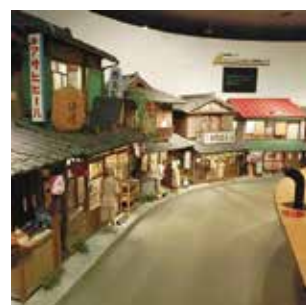
寅さん記念館山田洋次ミュージアム