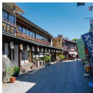
柴又帝釈天参道商店街